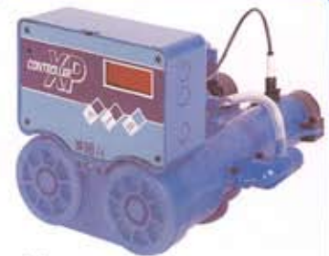
Valvola "132 T" rigen. a volume