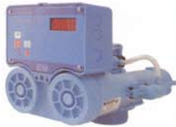
Valvola "132 A" rigen. a tempo