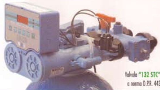
Valvola "132 STC" a norma D.P.R. 443

Le caratteristiche tecniche indicate nella sottostante tabella valgono per tutti i modelli della serie DAT / DAT-V / DAT-V STC.