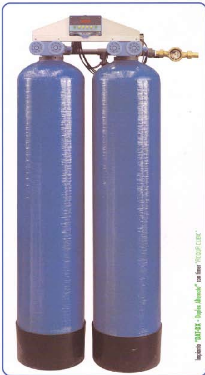
Impianto "DAT-DX - Duplex Alternato" con timer "RICOUPI CUBIC"

NOTE: we reserve the right to modify the technical and external characteristics of all the equipment offered.